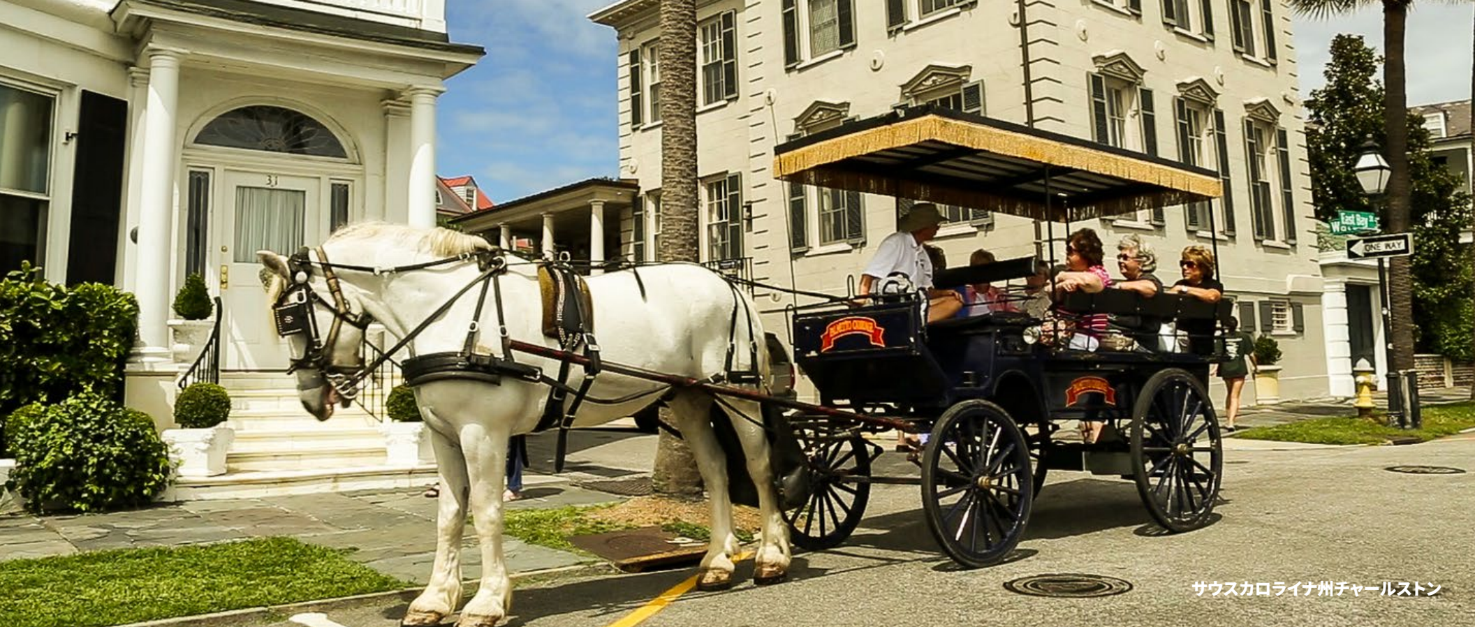
サウスカロライナ州チャールストン