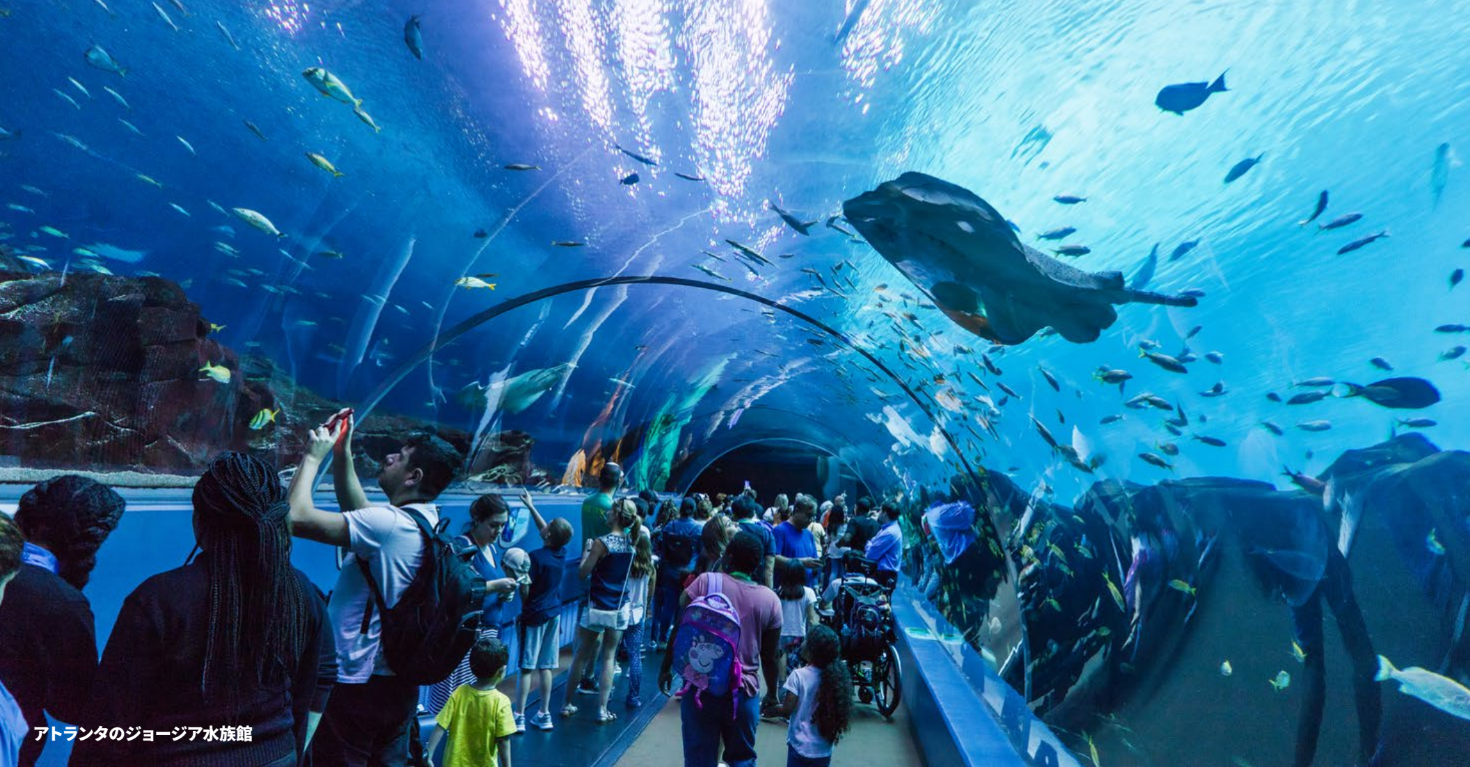
アトランタのジョージア水族館