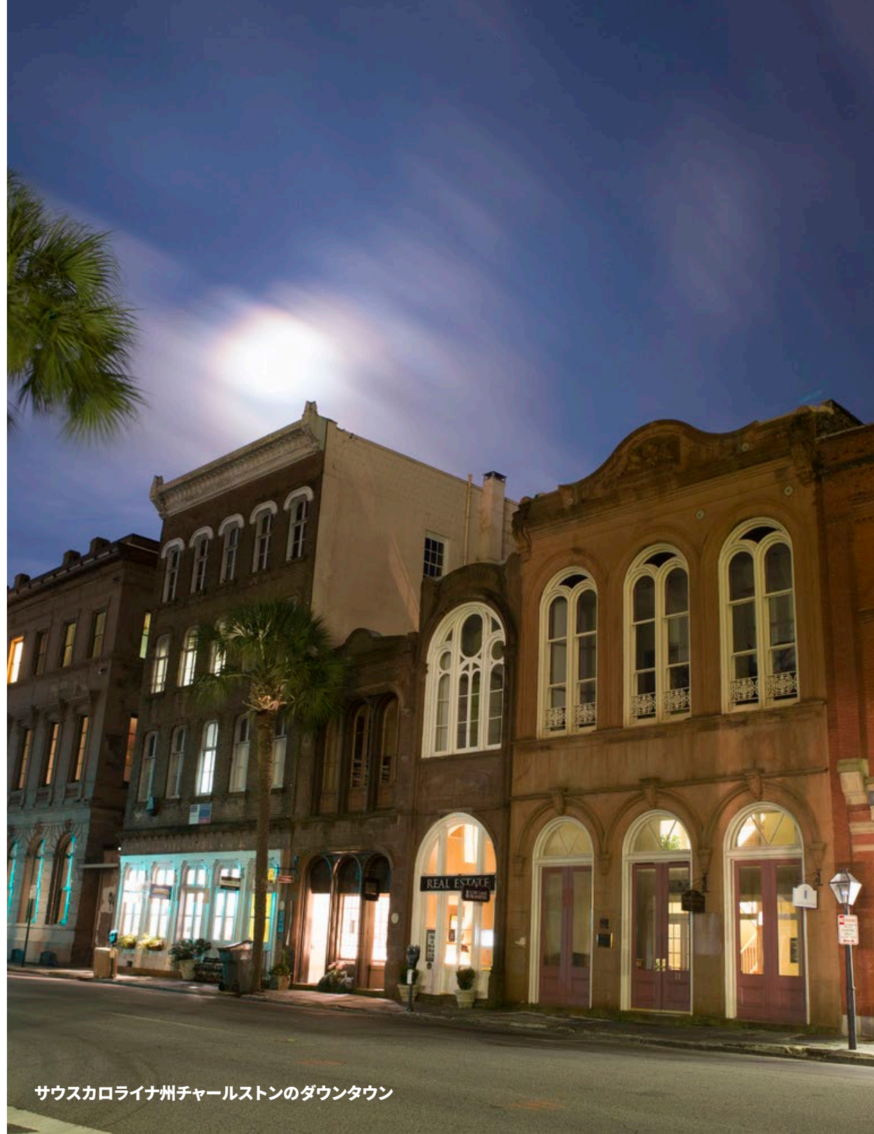
サウスカロライナ州チャールストンのダウンタウン