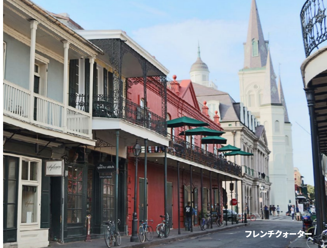
フレンチクォーター