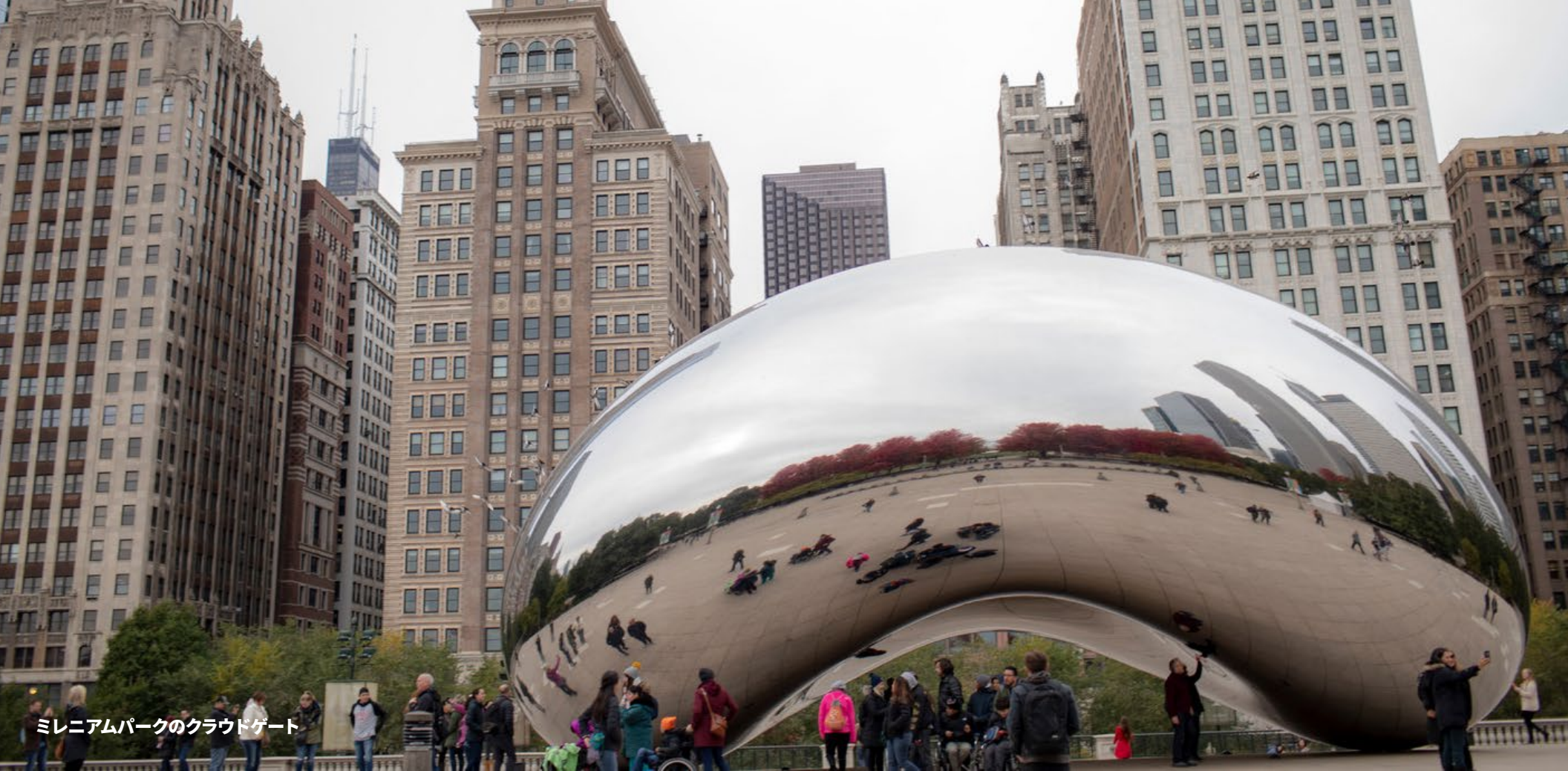
ミレニアムパークのクラウドゲート