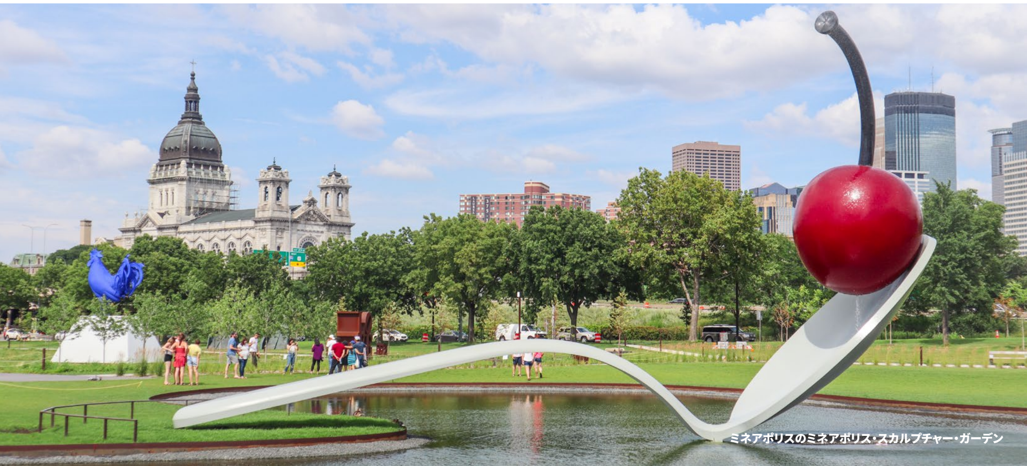
ミネアポリスのミネアポリス・スカルプチャー・ガーデン