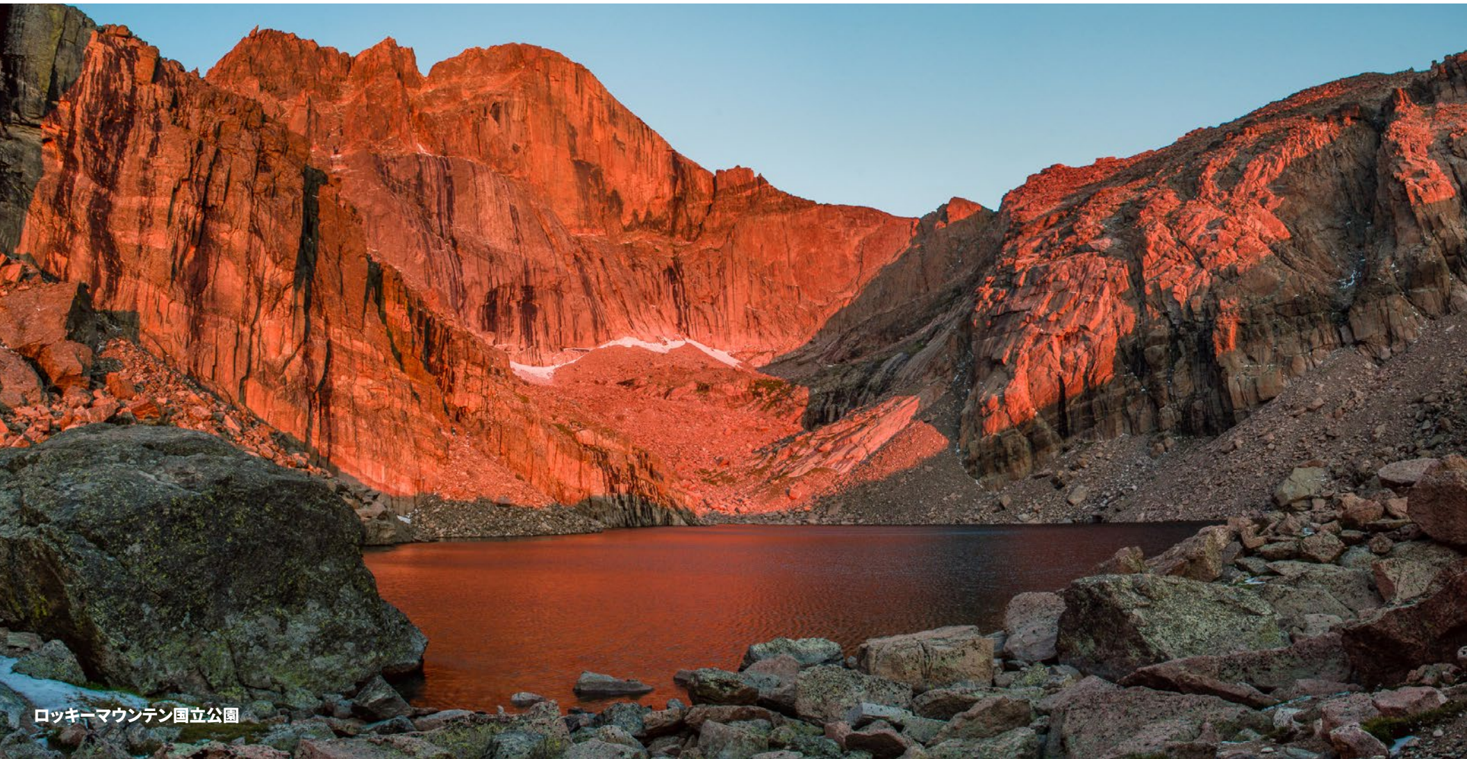
ロッキーマウンテン国立公園