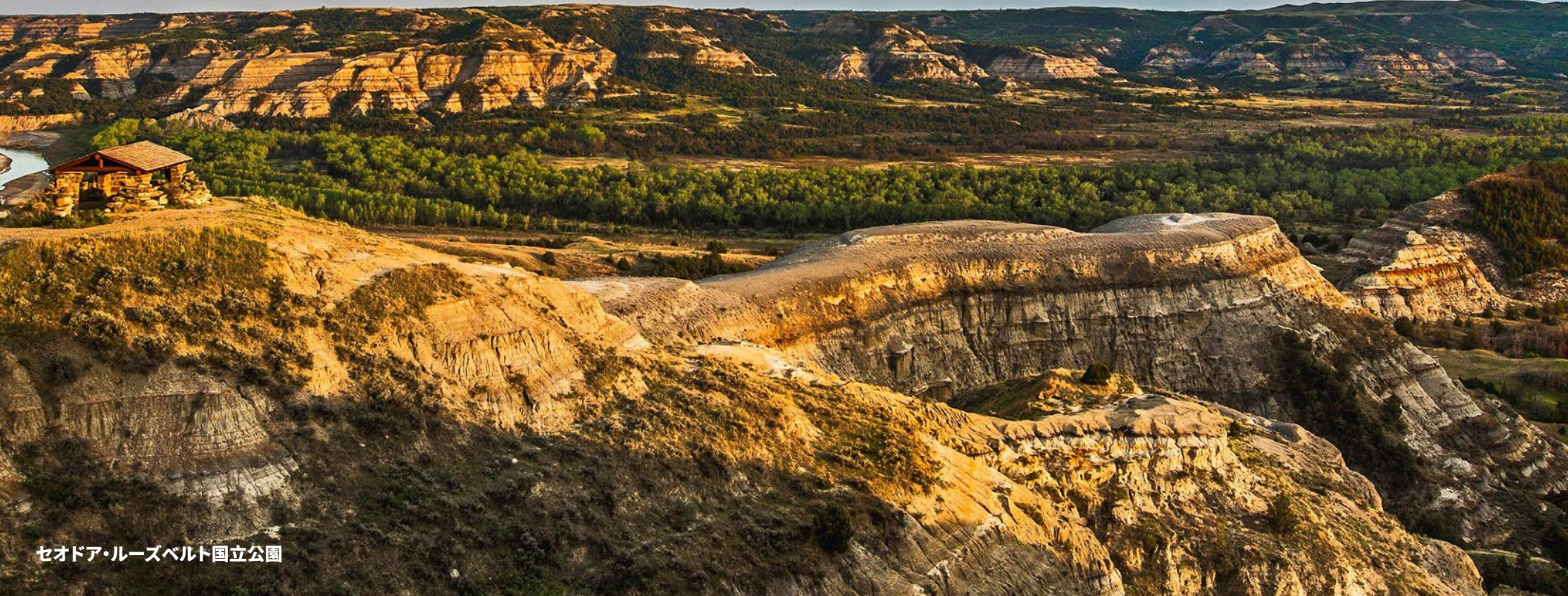
セオドア・ルーズベルト国立公園