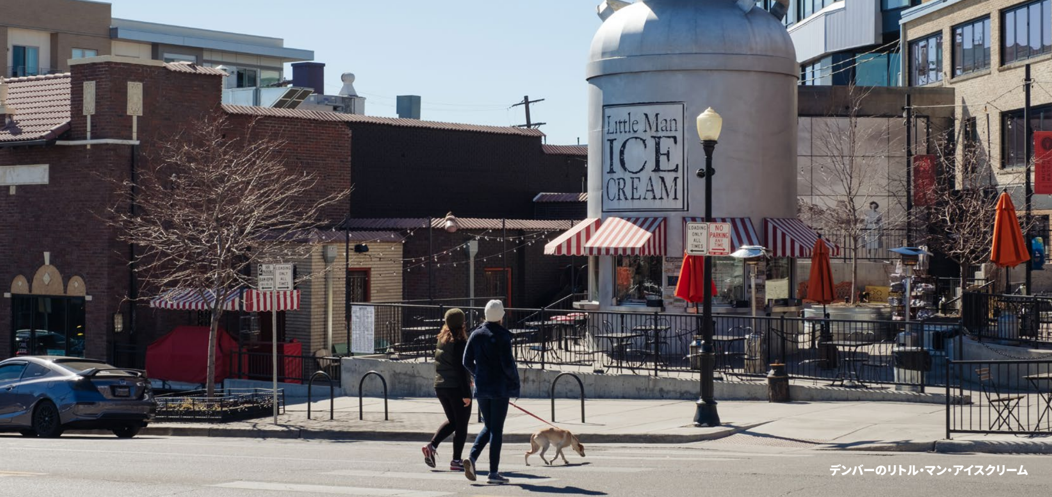
デンバーのリトル・マン・アイスクリーム